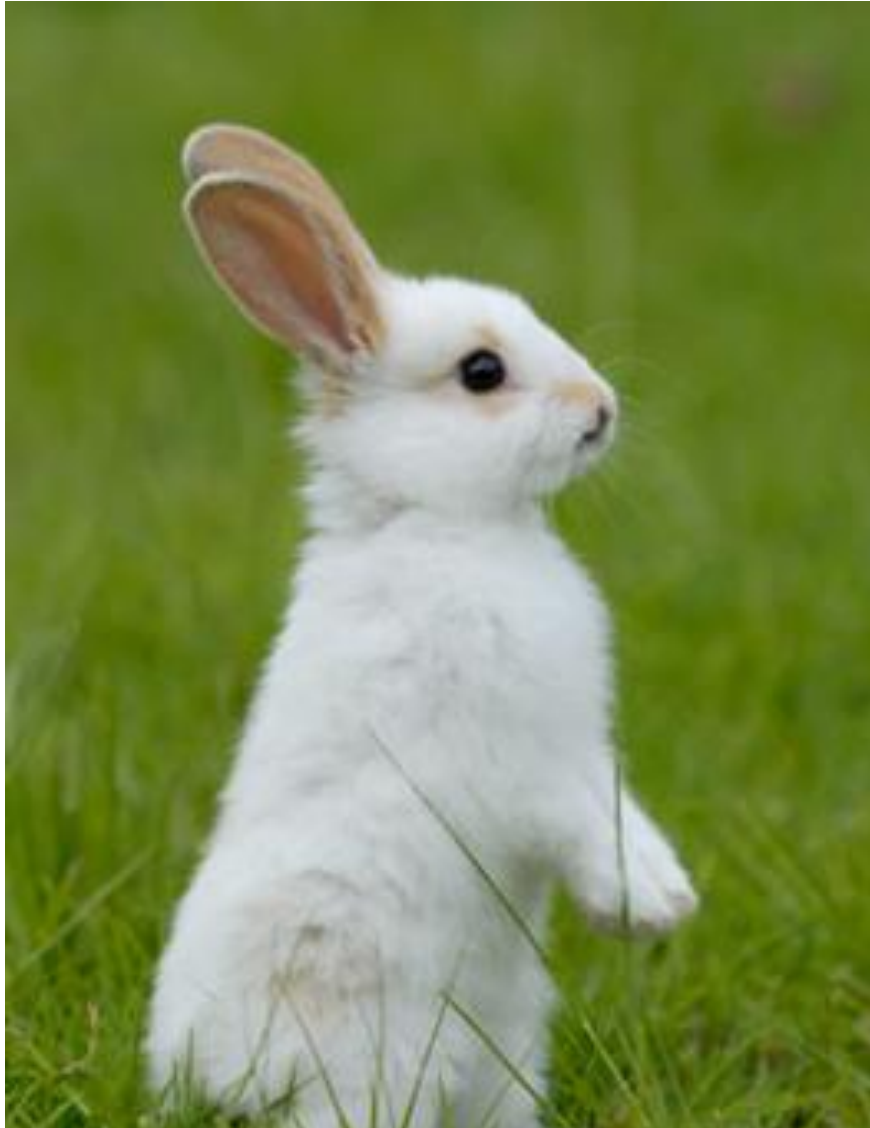
V : Les grandes oreilles du lapin .