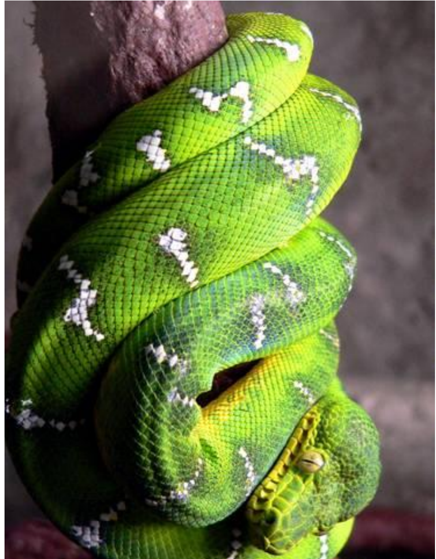
L : Le serpent qui grimpe le long d'une branche.