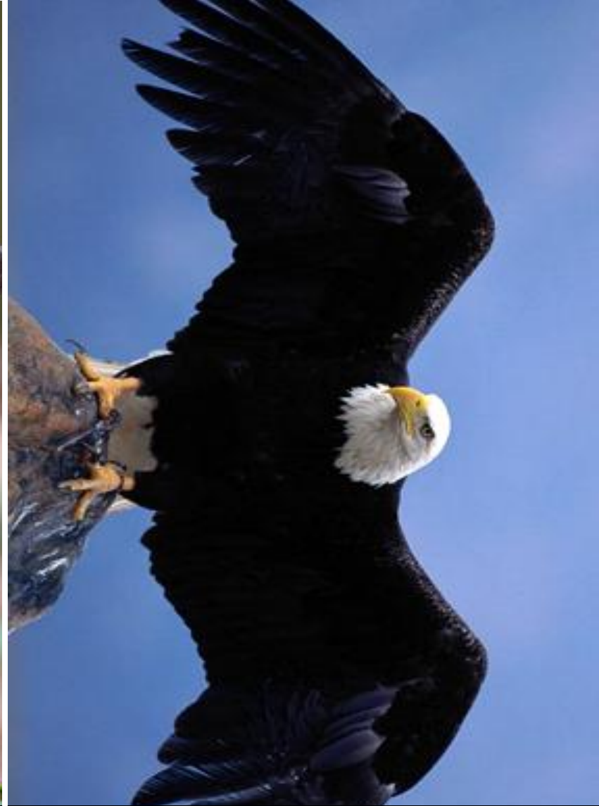
O: Les ailes de l'aigle .