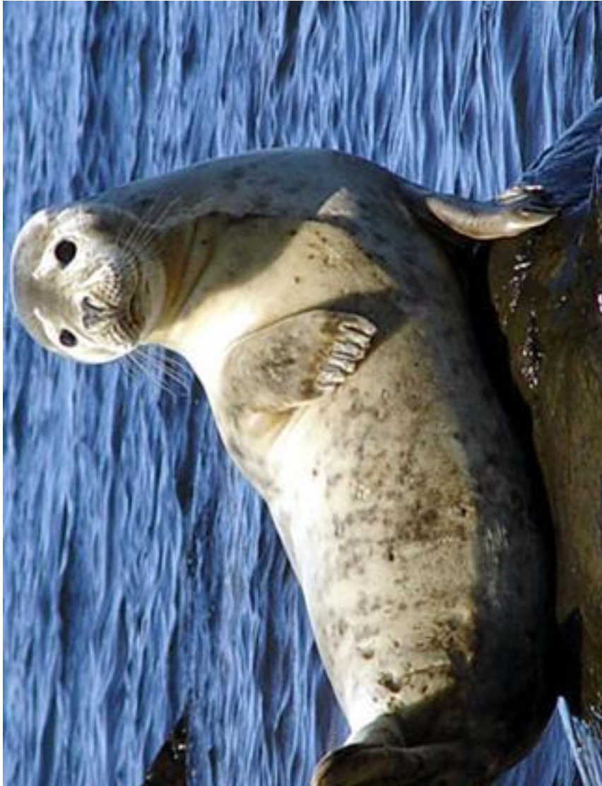
Z : La queue du phoque sur le côté.