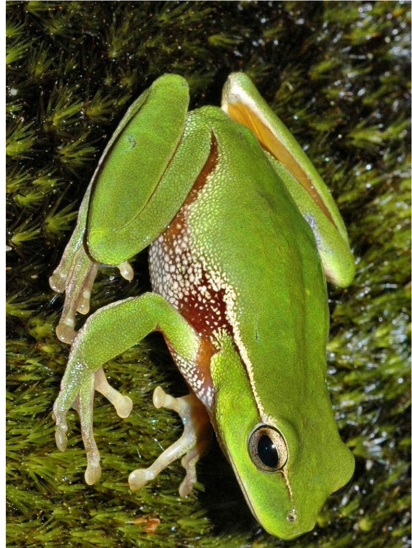
W : Position de la grenouille