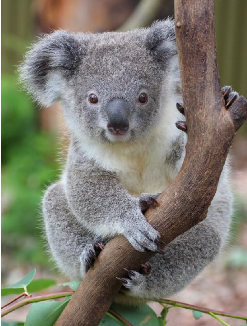
X : Le Koala qui croise ses jambes pour s'accrocher à la branche.